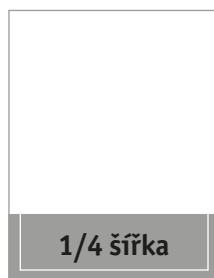
Formát na spad 225 × 86,5 mm Formát na zrcadlo 200 × 60 mm