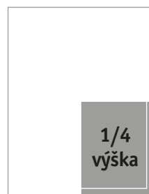
Formát na spad 110 × 144 mm Formát na zrcadlo 96 × 123 mm