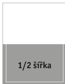
Formát na spad 225 × 144 mm Formát na zrcadlo 200 × 123 mm