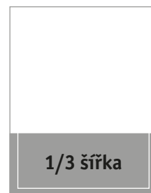
Formát na spad 225 × 98 mm Formát na zrcadlo 200 × 82 mm