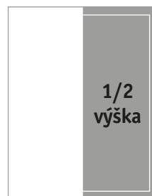
Formát na spad 110 × 296 mm Formát na zrcadlo 96 × 256 mm