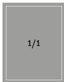
Formát na spad 225 × 296 mm Formát na zrcadlo 200 × 256 mm